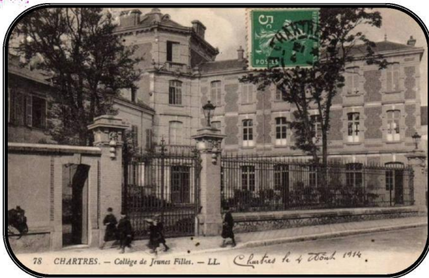
Collège de Jeunes Filles - Chartres- 1914