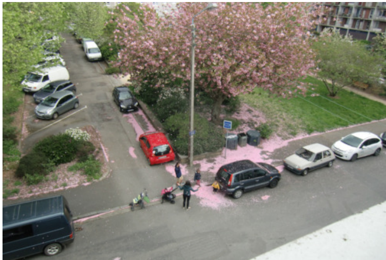
Brest place Sané, le 13 avril 2020 vers 11h. Promenade familiale salubre.

Je termine en vous envoyant quelques petits clins d'œil, mon dernier masque en tissu damassé quadruple épaisseur, un peu chaud pour l'été, ma fleur au chapeau, pure récup' de la cloche de Pâques qui était bourrée de vrais chocolats, et pourquoi le piano noir ? Parce qu'il ne s'y dépose plus de poussière... le rêve de la ménagère, enfin ! Et aussi la photo d'une famille