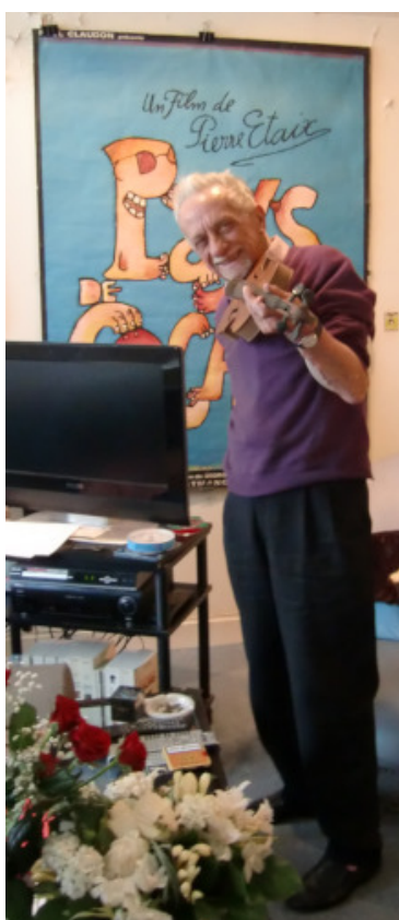
Paris, le 26 mai 2010.