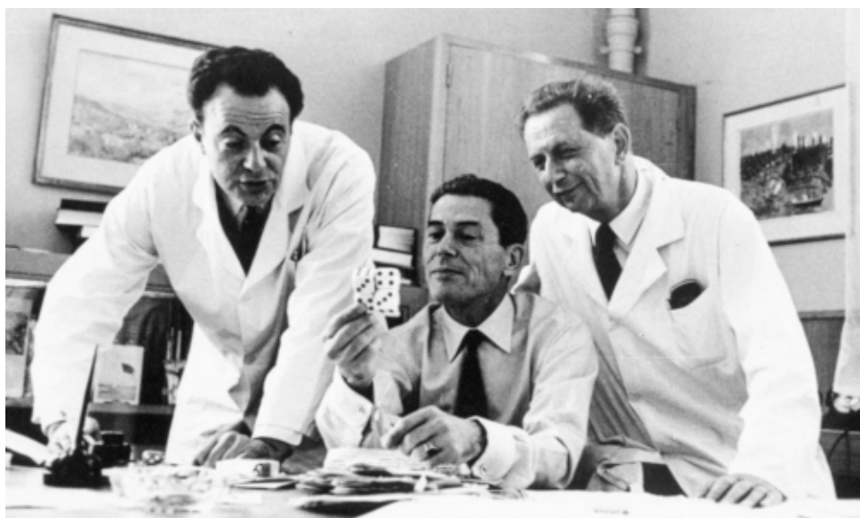
Les 3 prix Nobel de Médecine 1965.

En 1965, le prix Nobel de physiologie ou médecine 18 est attribué à André Lwoff, Jacques Monod et François Jacob « pour la découverte de la régulation génétique de la synthèse des enzymes et des virus ».