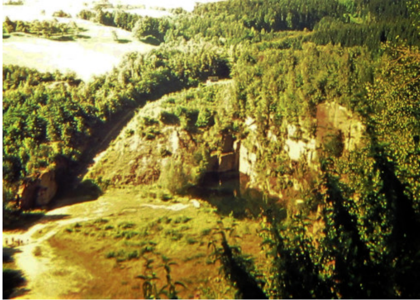
Camp de concentration de Mauthausen (Autriche), août 1966.

Vue d'avion de la carrière de pierre à droite et de « l'escalier de la mort », en arc de cercle à gauche, parcouru par les déportés, qui devaient remonter des pierres puis les rejeter en bas jusqu'à l'épuisement et la mort