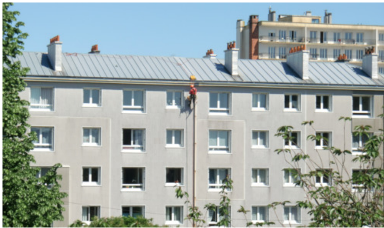
Brest place Sané, le 6 mai 2020 vers midi.

Vous trouvez le temps long ? Vous avez bien raison ! Sauf erreur, nous entamons la 8ème semaine : du jamais vu ! D'ailleurs, à regarder la place depuis mon 3ème étage, je crois que je commence à avoir des visions. Ce midi, en déjeunant, tout en jetant continuellement un œil par la fenêtre, voilà que j'aperçois sur la façade de l'immeuble en face... le Père Noël , oui, oui, oui ! Je vous assure !