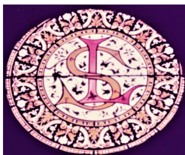
Château Stephen Liégeard de Brochon.