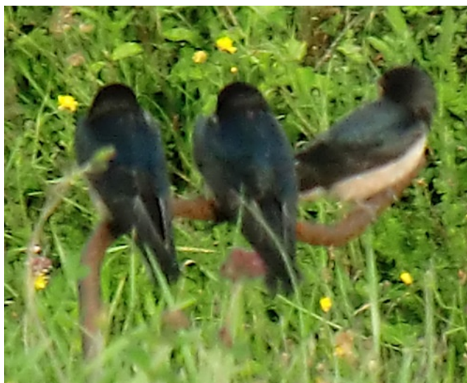
Centenaire 14-18 : pèlerinage au Fort de Vaux, près de Verdun, le 14 août 2014.

continuit ses audacieuses envolées avait quelques défaillances vocales » ; puis-je penser que, de son observatoire haut en altitude, elle avait une vision dantesque et inquiétante de l'immense champ de bataille ? « À Fleury, bouleversé par les explosions, théâtre de vingt luttes sanglantes, l'observateur a noté la présence de nombreux couples d'hirondelles, qui, au moment où nous nous préparions à l'attaque, se perchaient près de nos têtes, sur des lierres pendant des murs écroulés [...] en plein dans la zone la plus violemment battue par le feu, tout près de la redoute de Thiaumont, un couple de pies-grièches (ndlr : passereaux) a établi son nid sur des buissons d'épine noire à demi-carbonisés par l'incendie. Aucun bruit ne les trouble et les poilus se gardent de les déranger, pensant que le nid abritera bientôt des petits ». Les oiseaux sont donc là-bas, même dans la guerre, toujours les compagnons de l'homme, qui s'accroche à la vie, à la leur, à la sienne, si fragile. Souvenons-nous aussi du pigeon-voyageur « Vaillant », dernier pigeon du commandant Raynal envoyé du Fort de Vaux