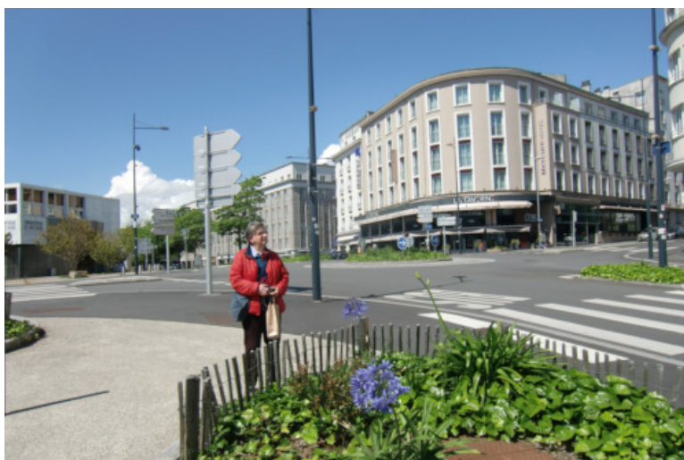
Brest ville morte, le 6 mai 2020 vers 14h.

À deux pas de la salle de spectacles Le Quartz à gauche, et de la place de la Liberté un peu plus loin à droite, un bus et quelques rares piétons sans doute concernés par les arrêts de bus et de tram près de la mairie