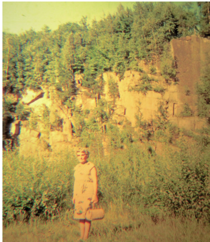
Camp de concentration de Mauthausen (Autriche), août 1966.

Après avoir été immatriculé et mis en quarantaine, il est affecté au Kommando de Melk. Ce qui est rare de la part d'un déporté, ses parents reçoivent le 27 juillet 1944 une carte écrite de sa main, datée du 7 juillet précédent 29 , dans laquelle il donne son adresse au camp de Mauthausen :