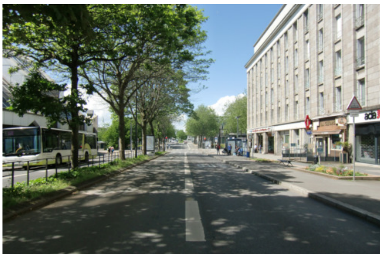
Brest ville morte le 6 mai 2020 vers 14h, e, pleine période de confinement.

En cette année 2020, ne pouvant inviter mon amie au restaurant pour son anniversaire le 17 mars, je lui sers un repas de fête « à ma façon » chez moi sur une table décorée comme pour Noël. Puis, dérogeant aux instructions édictées au plus haut niveau de l'État pour voir ce que devient notre ville, je l'entraîne à pied au port de commerce, malgré elle, qui est toujours respectueuse des consignes. Très peu de voitures, un véhicule de police nous observe, sans s'arrêter. Sur 2 km, nous ne croisons pas plus de 20 personnes : un désert, qui nous procure un certain état de malaise ! Sous un soleil radieux, l'activité du port réduite à zéro, quasiment seules assises sur un banc, nous méditons chacune pour soi, dans un silence total, face à la rade, dans un monde devenu étrange, pour une cause qui semble prendre de court la planète entière. Impressionnant ! Soudain, ce n'est plus la vie, c'est une opération de survie . Pour rentrer, nous empruntons le bus, vide, en montant, non plus à l'avant, mais par la porte médiane, le conducteur étant isolé par une paroi de plexiglas, et le composteur rapproché du nouvel accès. Dans tout le réseau brestois, les bus et le tram continuent à respecter les horaires antérieurs