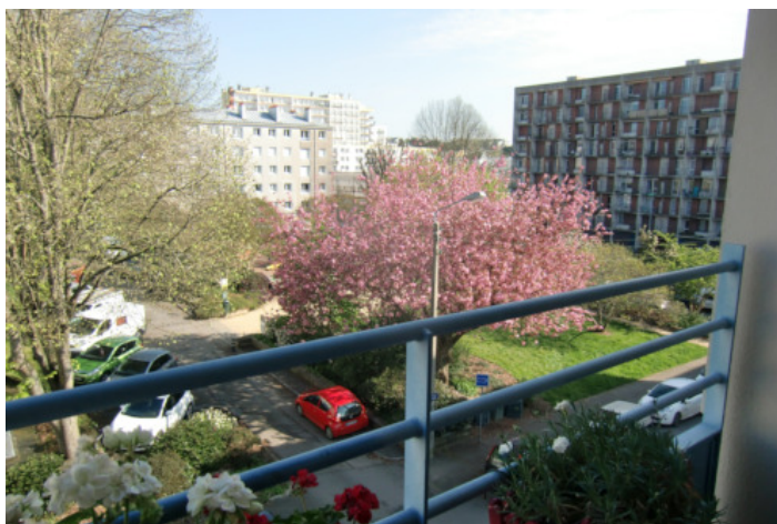
Brest, belvédère du 3 e étage, le 8 avril 2020 à 10h.